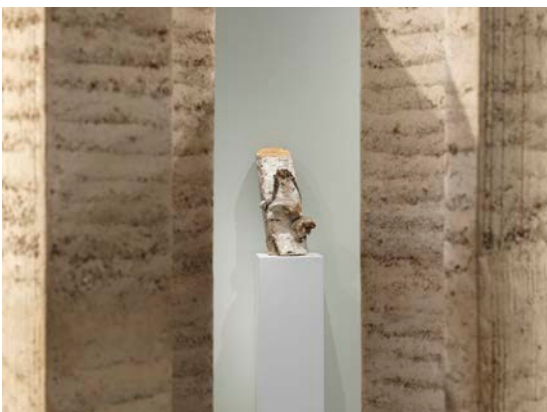
Ausstellungsansicht „Closer to Nature. Bauen mit Pilz, Baum, Lehm“, Berlinische Galerie