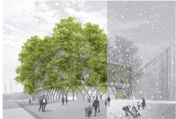
OLA – Office for Living Architecture, Wettbewerb „Haus der Zukunft“, 2012, Perspektive © OLA