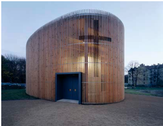
Reitermann / Sassenroth, Kapelle der Versöhnung, 1996–2000