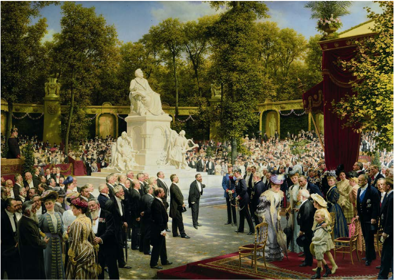
Anton von Werner, Enthüllung des Richard-Wagner-Denkmal im Tiergarten, 1908