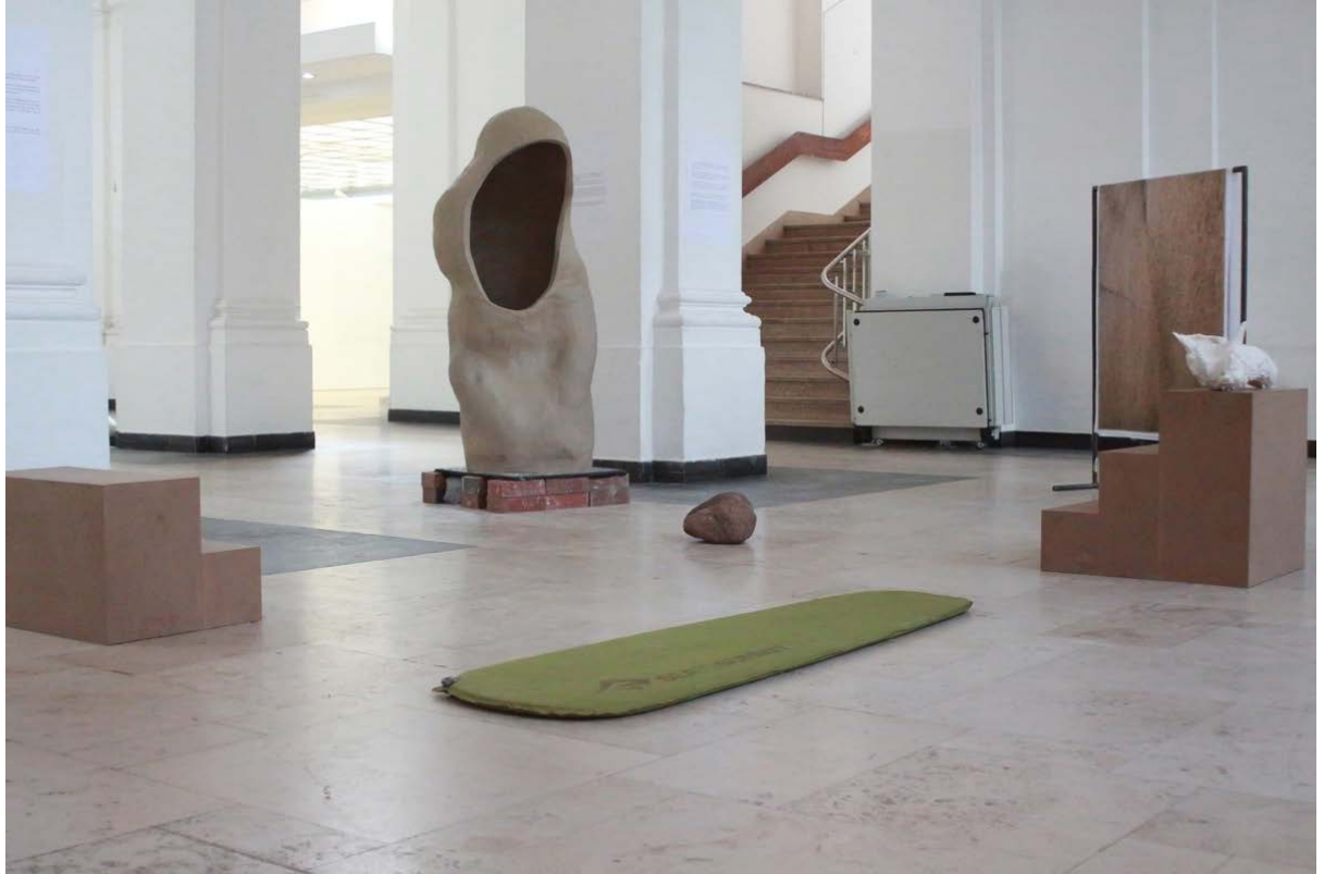
Sublimate - mit den Steinen atmen, 2023

Installationsansicht © Anna-Maria Podlacha