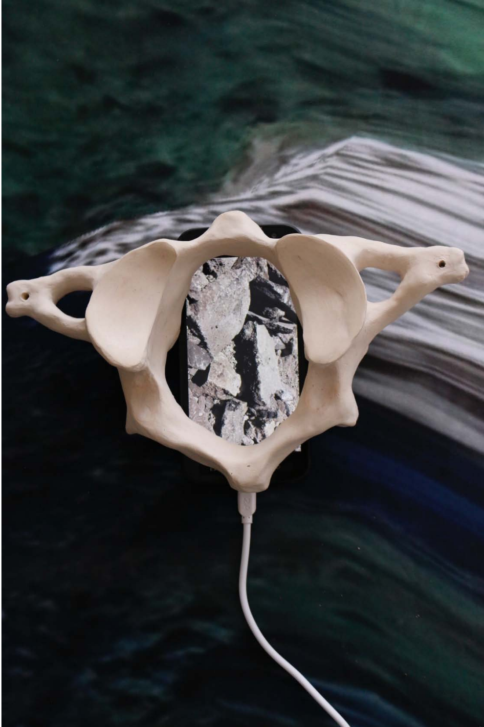
cuando vuelves a tu tierra, 2023

Multimediale Installation bestehend aus ungebranntem Ton, Video, Screenshots von Google Maps auf Textildruck © Marie Salcedo Horn