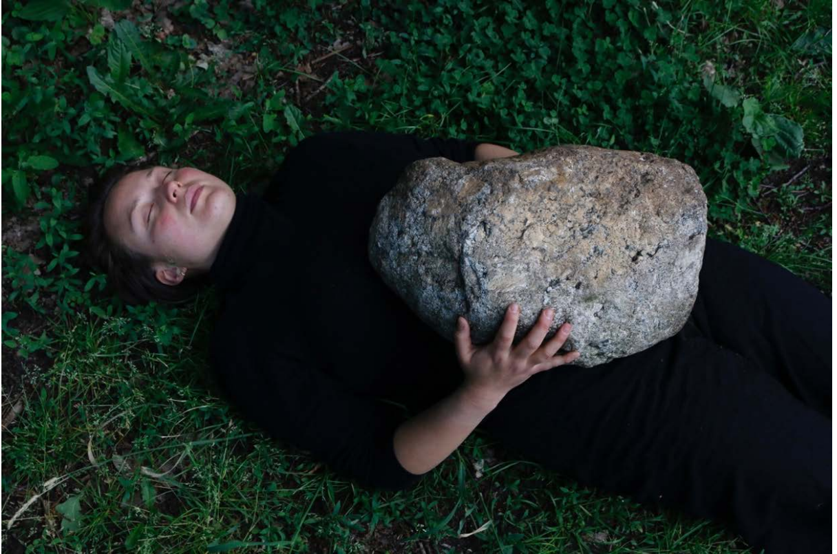
trying to be a stone – Performance, 2022