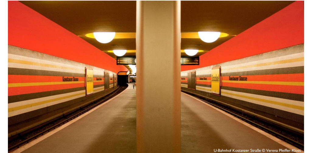
U-Bahnhof Kostanzer Straße

Kontakt: ICOMOS Deutschland, Brüderstr. 13, 10178 Berlin | icomos@icomos.de www.icomos.de