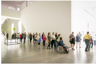
Rundgang „Kunst für Alle“, Lange Nacht der Museen 2018