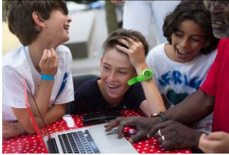
Filmworkshop in der Berlinischen Galerie