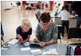
Ferienworkshop in der Berlinischen Galerie