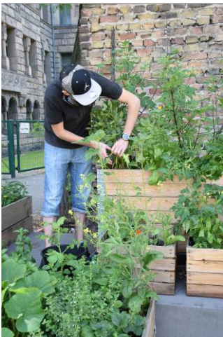
Gartensprechstunde im Gemeinschaftsgarten der Berlinischen Galerie

Freitags, 05.04.–24.05.2019, 16–17:30 Uhr Leitung: Thomas R. Hoffmann, Museumsdienst Berlin Kursgebühr 11 € pro Termin, inklusive Museumseintritt (bei Buchung aller 8 Termine: Kombi-Ticket 75 €), ohne Anmeldung.