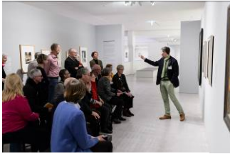
Zirkeltraining in der Berlinischen Galerie