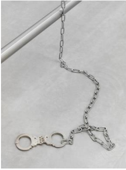
Waiting #1 (Detail) , 2017. Courtesy the artist and König Galerie, Berlin; Galerie Peter Kilchmann, Zürich; Galleria Raffaella Cortese, Mailand. Ausstellungsansicht, Berlinische Galerie, 2017. © Monica Bonvicini und VG Bild-Kunst. Foto: Jens Ziehe