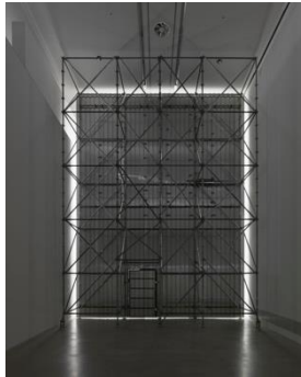
Passing , 2017, site specific installation. Courtesy the artist and König Galerie, Berlin; Galerie Peter Kilchmann, Zürich; Galleria Raffaella Cortese, Mailand, Ausstellungsansicht, Berlinische Galerie, 2017. © Monica Bonvicini und VG Bild-Kunst. Foto: Jens Ziehe