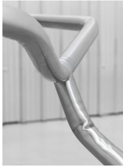
Waiting #1 (Detail) , 2017. Courtesy the artist and König Galerie, Berlin; Galerie Peter Kilchmann, Zürich; Galleria Raffaella Cortese, Mailand. Ausstellungsansicht, Berlinische Galerie, 2017. © Monica Bonvicini und VG Bild-Kunst. Foto: Jens Ziehe