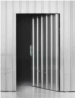
Passing , 2017, site specific installation. Courtesy the artist and König Galerie, Berlin; Galerie Peter Kilchmann, Zürich; Galleria Raffaella Cortese, Mailand, Ausstellungsansicht, Berlinische Galerie, 2017. © Monica Bonvicini und VG Bild-Kunst. Foto: Jens Ziehe