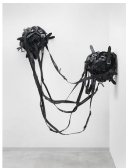
Belts Ball (double ball) , 2017. Courtesy the artist and Gerhardsen Gerner, Oslo, Ausstellungsansicht, Berlinische Galerie, 2017. © Monica Bonvicini und VG Bild-Kunst. Foto: Jens Ziehe