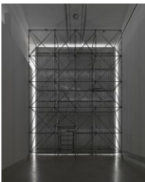
Passing , 2017, site specific installation. Courtesy the artist and König Galerie, Berlin; Galerie Peter Kilchmann, Zürich; Galleria Raffaella Cortese, Mailand, Ausstellungsansicht, Berlinische Galerie, 2017. © Monica Bonvicini und VG Bild-Kunst. Foto: Jens Ziehe

Pressekonferenz: 14.09., 14:30 Uhr, Eröffnung: 15.09., 19 Uhr